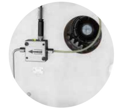
Schmierstellensensor zur Überwachung der Großradschmierung