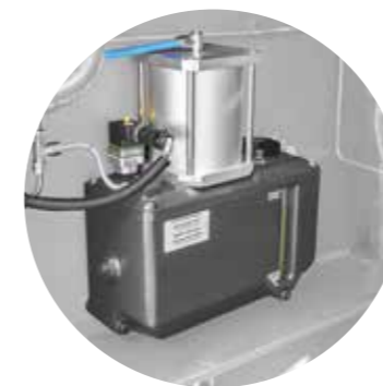
Neue Zentralschmierung (optional)