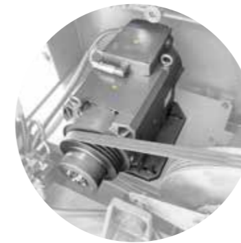
Neuer frequenz geregelter Antrieb - stufenlos regelbar

Damit Sie alle Vorteile der BC R-Steuerung nutzen können, sind diverse Erneuerungen an der Maschine durchzuführen. Diese sind im Basispaket enthalten. Darüber hinaus können Sie optional zusätzliche Erneuerungen auswählen. Die wichtigsten Maschinenkomponenten hierbei im Überblick: