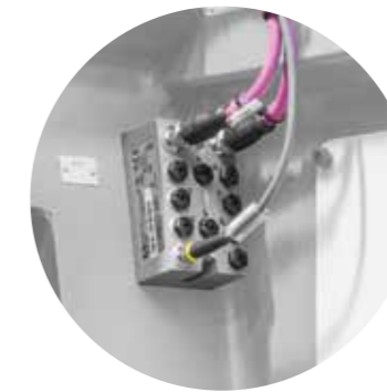
Frei programmierbare Ein- und Ausgangsmodule