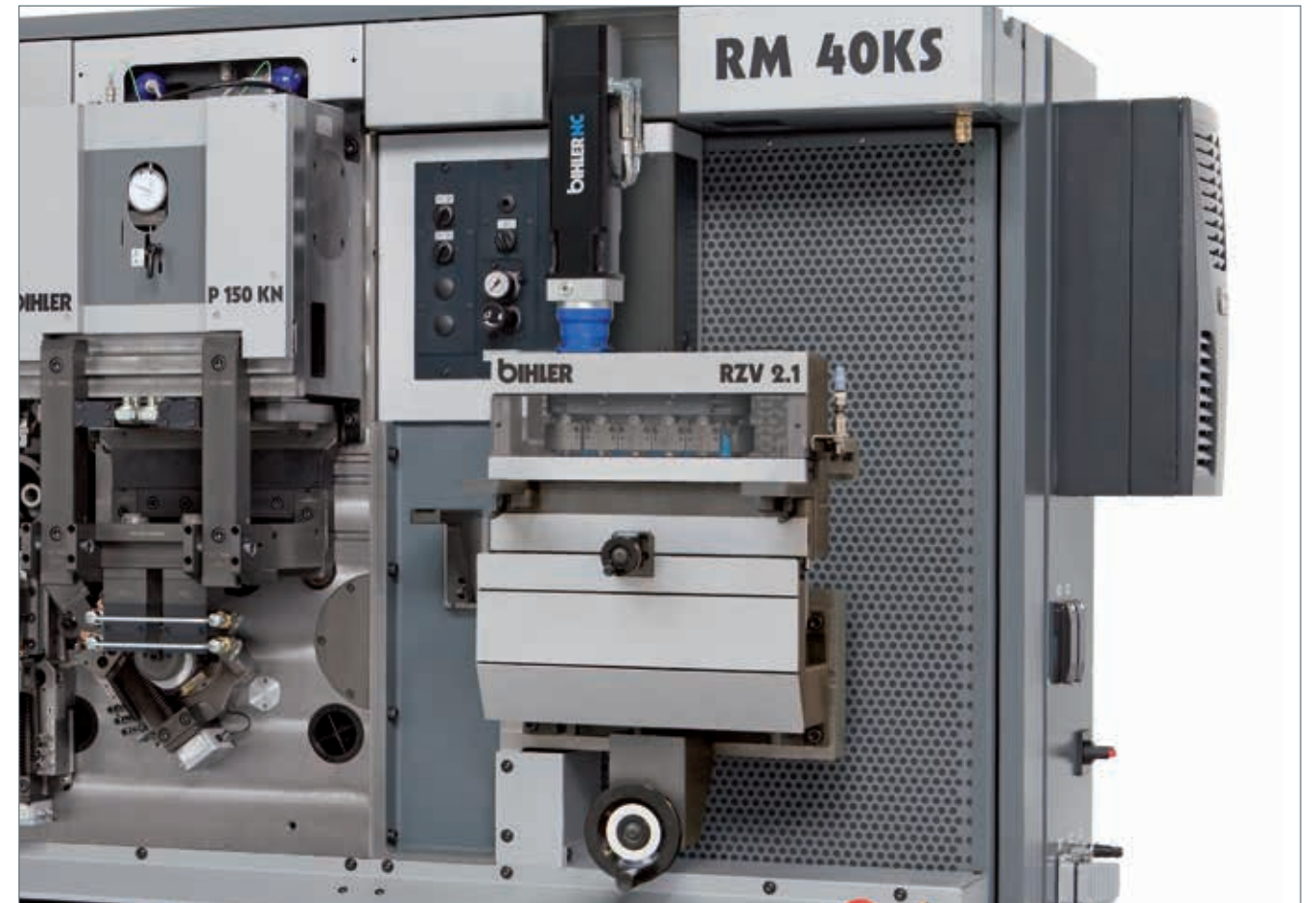
RZV 2.1 mit 2 Achs-Verstellvorrichtung und Berührungsschutz

Einfache Programmierung und komfortable Bedienung über Maschinen- und Prozesssteuerung VariControl.