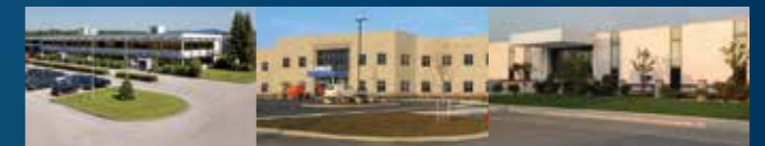
● Bihler Füssen ● Bihler of America Inc. Phillipsburg, NJ ● Bihler Machinery Kunshan ● Handelsvertretungen

Kundennähe, direkter Kontakt und ständige Kommunikation haben oberste Priorität bei Bihler. Wir stehen Ihnen jederzeit mit schnellem Support zur Verfügung - an jedem Ort dieser Erde. Dafür sorgt unser weltweites Service- und Vertriebsnetz mit Niederlassungen in den USA und China sowie Handelsvertretungen in den wichtigsten Industrienationen. Zentrale Schnittstelle aller Aktivitäten ist der Bihler-Stammsitz in Halblech.