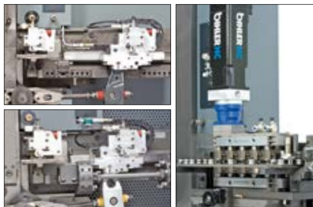
Optional NC-Einzug RZV 2 oder Revolvereinzug

Die RM 40B ist bei Bihler als Komplettpaket erhältlich bestehend aus kompakter Grundmaschine, serienmäßigem Zubehör und übersichtlichen Werkzeugkomponenten. Zum Zubehör gehören ein mechanischer Zangeneinzug mit hydr. Klemmung, der Richtapparat BRA-II-75, eine 70 kN Zweipunkt-Exzenterpresse mit 12 mm Hub, zwei zwangsläufig gesteuerte Normalschlitzenaggregate mit 30 kN Nennkraft und 25 mm Hub, ein Mittelstempel mit max. Nennkraft 30 kN und 50 mm Hub, eine 60 kN Querpresse mit 35 mm Hub, ein Drehtellerantrieb sowie ein Personenschutz.