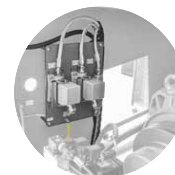
Nuove interfacce per il collegamento di periferiche (opzionale)