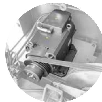
Nuovo sistema di azionamento regolato a frequenza - regolabile in continuo

Affinché possa godere di tutti i vantaggi offerti dal sistema di controllo BC R, sono necessari alcuni interventi di aggiornamento sulla macchina. Tali interventi sono inclusi nel pacchetto base. Potrà inoltre avvalersi di ulteriori aggiornamenti opzionali. Ecco una breve descrizione dei principali componenti della macchina: