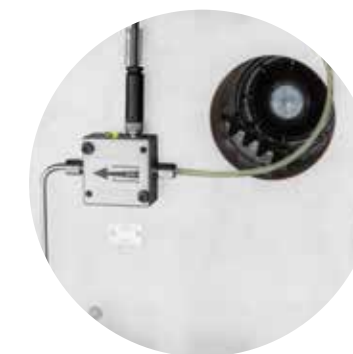
Sensore dei punti di lubrificazione per il monitoraggio dell'ingrassaggio della ruota dentata