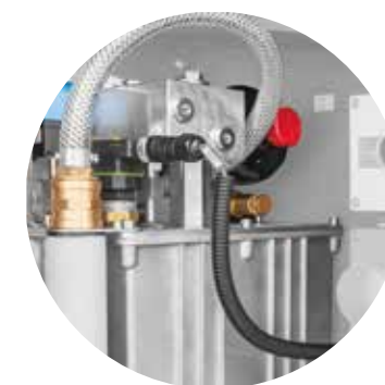
Nuovo sistema idraulico (opzionale)