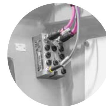
Moduli di ingresso e uscita liberamente programmabili