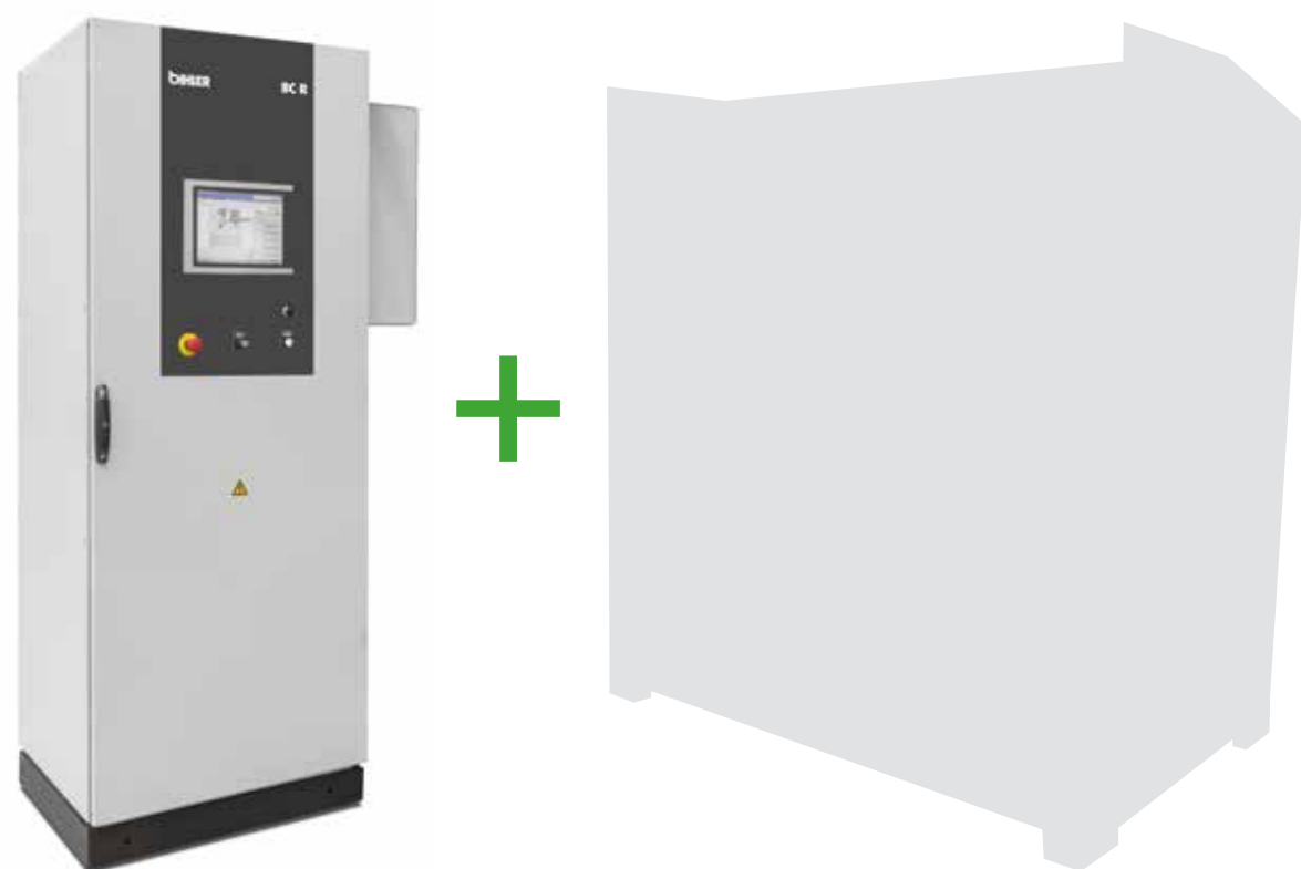
Sistema di controllo BC R

La macchina soddisfa in tal modo i più recenti standard di sicurezza e può essere collegata in rete, perfettamente al passo con l'era digitale. Ulteriori funzioni, quali ad esempio il sistema di comando semplice e intuitivo, le funzioni di monitoraggio, il volante di azionamento per la regolazione precisa e definita dei movimenti degli utensili e molto altro ancora, rendono la macchina ora ancora più produttiva.