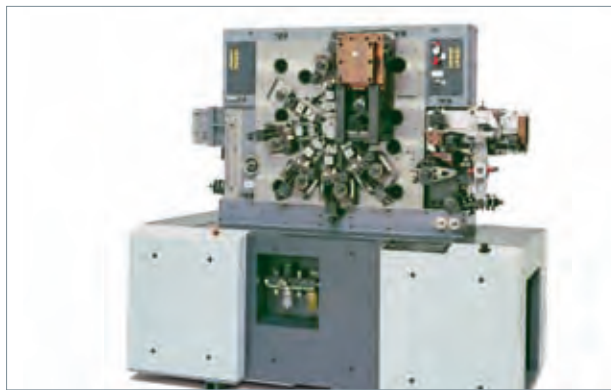
Multicenter MC 42