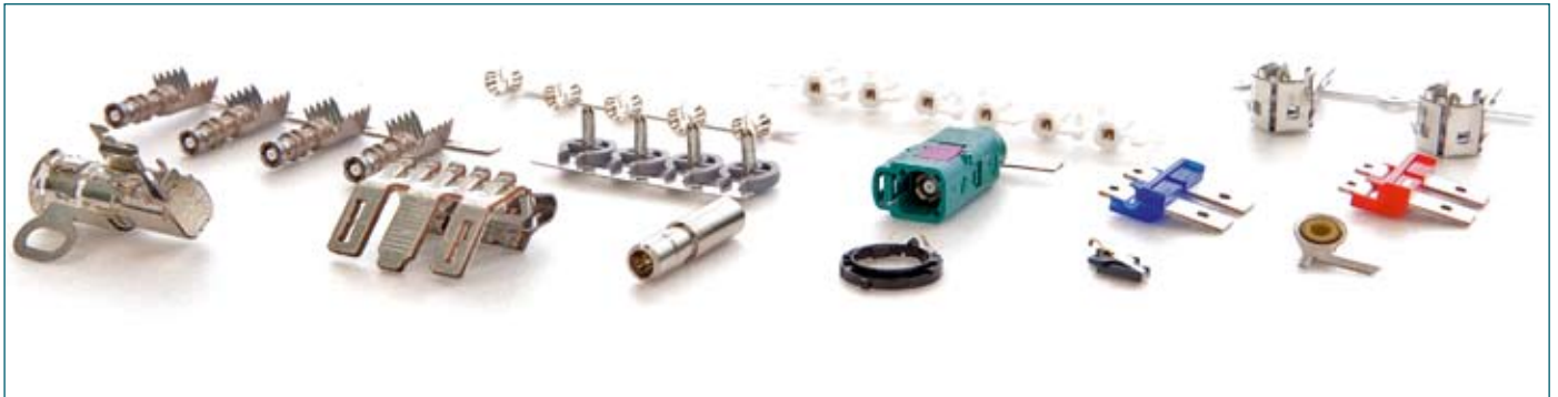
Vorteil der Bihler-Automaten ist die Werkzeuglänge im kompakten Bauraum: 720 mm Werkzeuglänge bei einem RM 40.

Bogner hängen, sagen einige seiner Kunden und montieren lieber mit 20 Takten auf ihren Rundtaktmaschinen, statt mit 200 Takten auf den Bihler-Automaten. Bogner zieht dann auch gleich ein Teil aus dem Hochfrequenzbereich mit montierter Feder aus dem Musterkasten, um einen zentralen Vorteil der integrierten Montage zu veranschaulichen. „Das Stanzen und Biegen dünner auch federnder Teile mit Schlitz- und Öffnungen ist kein Problem,“ sagt Bogner. „Nur hätten solche Teile den Nachteil, dass sie sich als Schüttgut zu unentwirrbaren Klumpen verhaken und deshalb besonders zu verpacken sind, wenn sie am Rundschaltisch vereinzelt und montiert werden müssen.“