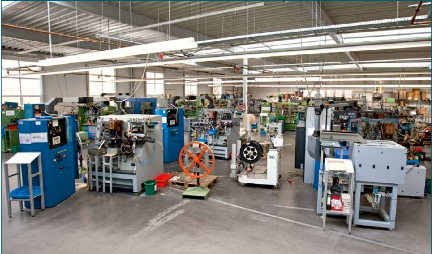
In der großzügigen, hellen Fertigungshalle arbeiten 18 Bihler-Automaten vom RM 40 bis zum MC 82.